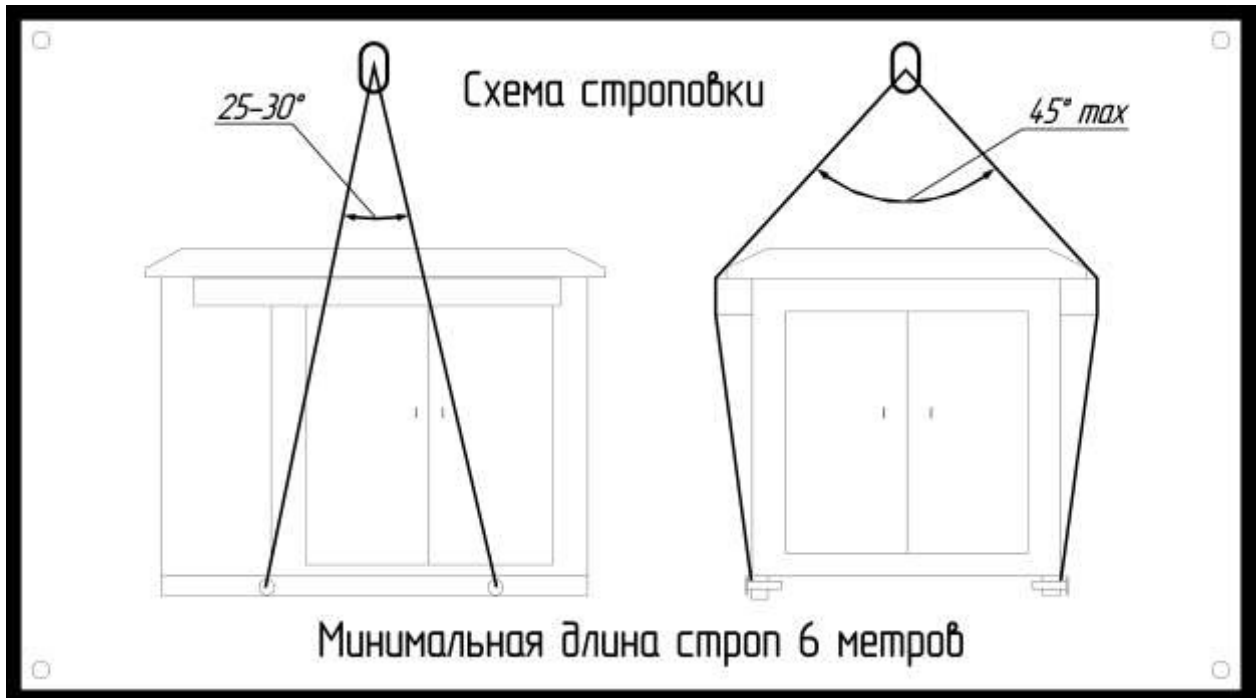
Схема строповки КТПК с нижними грузоподъёмными устройствами

Примечание – При погрузке необходимо учесть временное увеличение ширины КТПК на 200 мм за счёт установки устройств для подъёма и выступающих частей. На время транспортировки устройства для подъёма задвигаются внутрь.